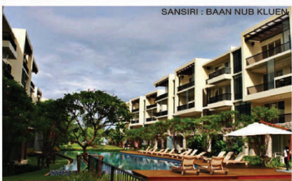
SANSIRI : BAAN NUB KLUEN