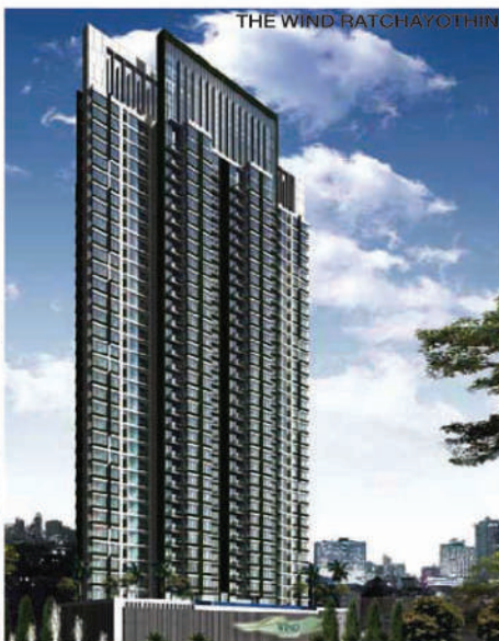
THE WIND RATCHAYOTHIN