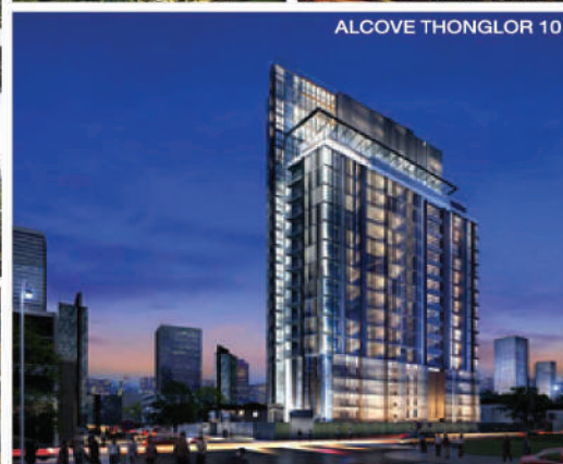
ALCOVE THONGLOR 10