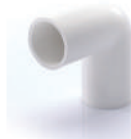
ข้องอ 90° ร้อยสาย ขาว 18-25 มม. (1/2"-1")