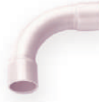
ข้อโค้ง 90° ช่วงสั้น ร้อยสาย ขาว 15-25 มม. (3/8"-1")