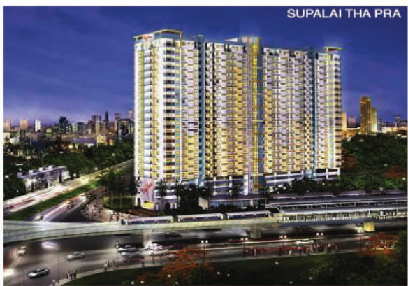
SUPALAI THA PRA