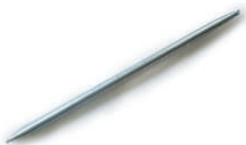
สปริงคัตท่อ ร้อยสาย ขาว 15-25 มม. (3/8"-1")